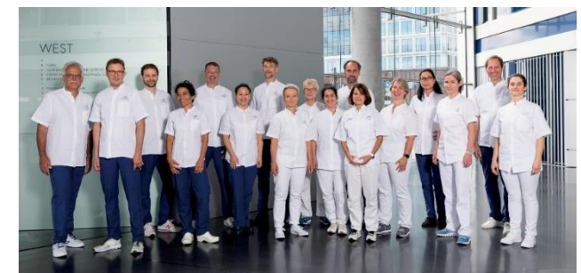
Das Ärzteteam der FRAUENKLINIK AN DER ELBE

Sie dürfen nur in Begleitung in Ihre häusliche Umgebung zurückkehren: Ohne eine gesicherte Betreuung bis zum nächsten Morgen können wir Sie nicht ambulant operieren . Wenn Sie zu Hause ankommen, sollten Sie sich insbesondere am OP-Tag schonen. In sehr seltenen Fällen kann es aus medizinischen Gründen notwendig sein, Sie nach der Operation in ein mit uns kooperierendes Krankenhaus zu verlegen.